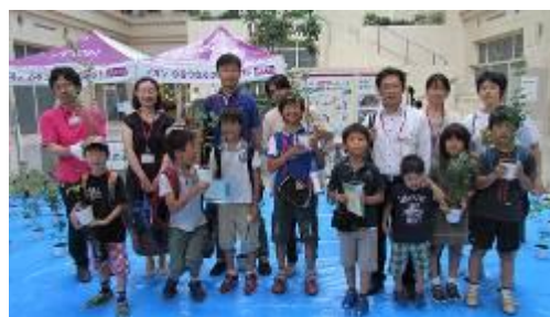
「树苗守护者活动」中、将精心培育的树苗送回的人们