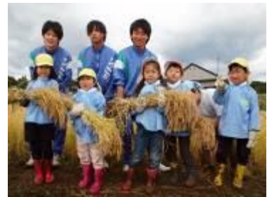
气仙沼市立大谷中学