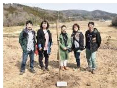
永旺零售株式会社员工的植树活动