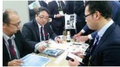
2016 年 1 月 「永旺东北复兴支援商谈会」

从今年 1 月开始将展开全新的「永旺东北复兴支援商谈会」。来自东北 40 间贸易伙伴公司的约 130 人，与东北集团企业旗下的约 70 名采购员，为扩大东北商品的销路进行商谈。