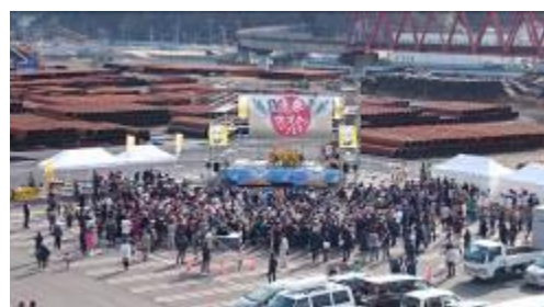
在停车场举办的 「舞虎节」