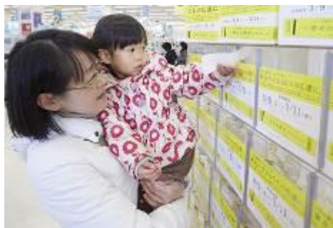
2014年 东北支援 「永旺 幸福的黄色收银条活动」

全国各地的顾客一起为岩手·宫城·福岛的受灾民众加油。在每月11日所实施的「永旺 幸福的黄色收银条活动」中，扩大到每年3月9-11日。活动期间会将客户投入的收银条合计金额的1%用于捐赠。至2015年为止，此活动累计向受灾地区捐赠的金额总数达到了6亿2,603万日元。