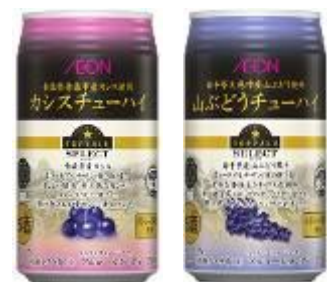
使用青森・岩手产原材料的 「TOPVALU SELECT」利久酒 (期间限定销售)