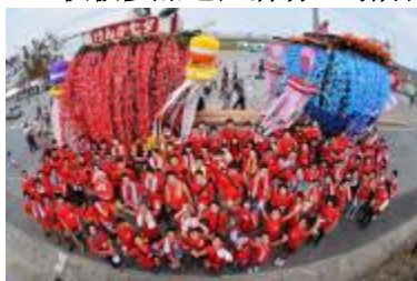
2015年 参加“七夕节”的活动场景

株式会社霞自2012年开始，与该公司分店所在地区的孩子们共同参加岩手县陆前高田市举办的「七夕节」活动。并与当地居民一道肩负彩车加深了彼此关系。此外还听取了参加者对于受灾地区目前的见闻感触，并举办了防灾学习会。过往4次学习会的参加人数超过了670名。