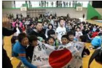
签满了孩子们祝福的旗帜

公益财团法人永旺 1%俱乐部自 2012 年展开「孩子们的梦想・支援活动」以来，为爱好运动、音乐及文学的孩子们举行了各类活动。第一届「东北之梦想」则请来了在伦敦奥运会上拼搏的选手，通过运动教室活动，为宫城县七滨町的汐见小学的孩子们描述了坚持梦想的重要性。此次前来的伦敦奥运会体操项目金牌获得者内村航平选手，还特地带来了当时欢庆胜利时，曾身披的签满了孩子们祝福信息的旗帜。