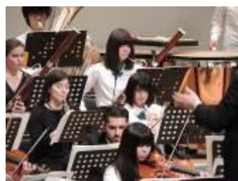
协奏中的仙台少年管弦乐团与维也纳·歌剧·踢踏舞管弦乐团的团员

此外作为该活动的一个环节，在 2013 年 6 月仙台国际音乐比赛中获得小提琴部门和钢琴部门的前几位获奖者也访问了宫城县的 2 所小学校，举办了迷你音乐会与音乐教室活动。