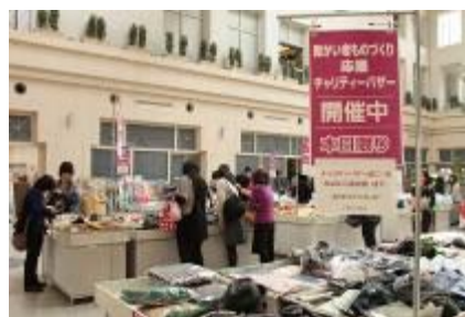
「援助残障人士的手工作品」 慈善义卖会