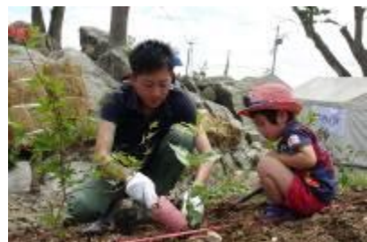
2013 年 宫城县 气仙沼-景岛神社内植树情况