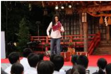
讲述故事中的女演员 浅野温子

公益财团法人永旺 1%俱乐部邀请了女演员浅野温子女士为当地的中学生们讲述可流传后世的各地民俗，希望能使同学们能深入了解故乡，从而更加热爱自己的故乡。此活动从 2012 年开始实施，至今已举行了 5 次，宫城县内约 2,100 名的同学都有机会参加了活动。