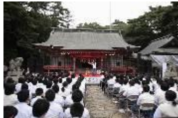
2014 年 气仙沼御崎神社