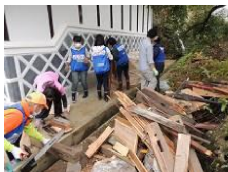
收拾残垣 员工志愿者

「永旺 心手相连计划」预计在10年内，动员30万员工参与复兴支援志愿活动。现在已有超过18万6,000人次的全国集团企业员工在岩手县、宫城县、福岛县以各种形式参与了相关的志愿活动。