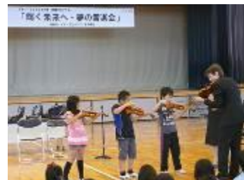
2013 年 多贺城东小学校内举办的小提琴指导教室