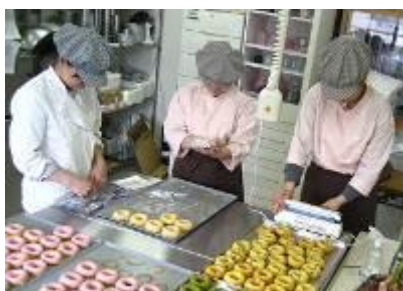
福岛县 岩城市的授产设施中 制作面包圈的场景

公益财团法人永旺1%俱乐部自2012年开始，为了对东日本大地震中受灾残障人士制作施設（教导生产施設）中的生产设备建设及产品销售进行援助，在全国进行了募捐活动。通过认定的NPO法人难民救助会，到现在为止，针对宫城、岩手、福岛县的授产施設96处，提供了总计1亿1,800万日元的援助。