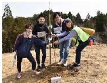
株式会社 COX 的员工植树场景

「Orgabits」是由纤维的专业商社丰岛株式会社所倡导的，鼓励大家使用有机棉以贡献微薄之力，从而实现保护地球环境的社会贡献型活动。运营服装专门店「Self+Service」的永旺零售株式会社的自助服务部门与运营「ikka」的株式会社 COX 都赞赏此项施策，因而加入了「樱树活动」。此活动是为了避免因东日本大地震引发的海啸造成风化，以及避免今后可能会发生的类似灾害，在东北海啸易发地段种植樱树所展开的活动。针对顾客购买的每件特定商品，将会支付 10 日元给「NPO 法人 樱树网络」，