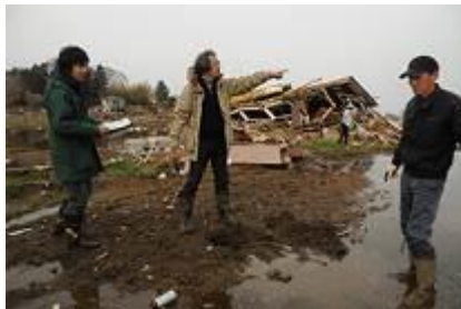
特定非盈利活动法人稻田

1991 年开始每年实施的环境活动资助, 在进入 25 周年的今年中, 将会向在宫城县进行植树活动的「公益财团法人将废墟变成森林的长城活动」及「NPO 法人 传递绿色腰带活动」等, 在受灾地区进行植树活动的各团体进行资助。