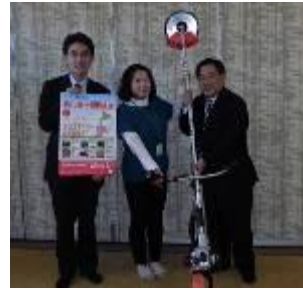
2014 年 南相马市向社会福利协议会 捐赠务农

ORIGIN 东秀株式会社自 2014 年起，开展了「东北的美食 创意·制作·品尝后援活动」。在公司内部募集了采用当地食材所制作的当地美味的菜谱，商品化后推向市场。并将部分收益作为农耕机具的采购费用，捐赠给急需的受灾地区。员工们也可轻松的参加到援助东北的活动中。