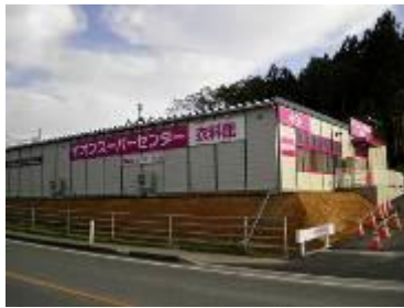
永旺购物中心 陆前高田服装馆

永旺株式会社在 2012 年 10 月也与东北六县及仙台市，缔结了地区复兴以及防灾等相关协议。