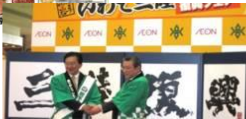
2011 年 岩手三陆复兴节