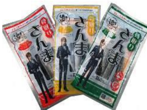
2012 年销售的 Fast Fish 「去骨秋刀鱼」