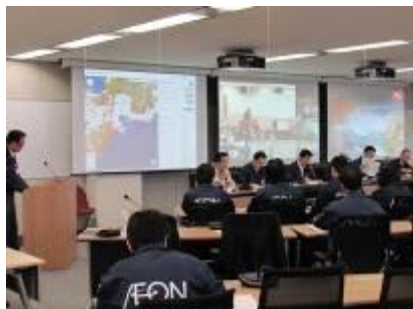
永旺小牧危机管理中心

为应对基于BCP（业务持续计划）中所设想的首都地区直下型地震，2014年在爱知县小牧市的永旺小牧店设立了专门进行危机处理的「永旺小牧危机管理中心」。当幕张总部因地震受损而无法行使指挥之时，以担任临时对应中心之职能。同时吸取东日本大地震之教训，为确保顾客与员工的安全，还将在各地区陆续实施「集团综合地震防灾训练」，以保证灾害发生时能迅速应对。