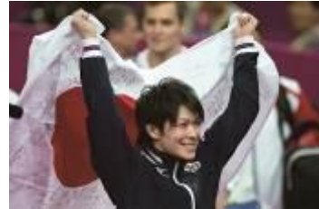
欢庆胜利的内村航平选手