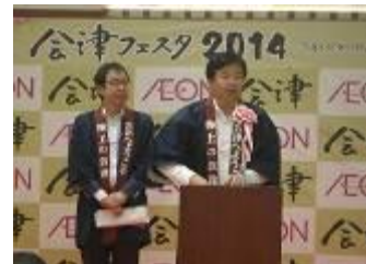
2014 年 会津节