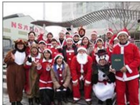
装扮成圣诞老人 为临时住宅的孩子 赠送礼物