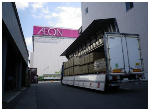
交货时卸货的情景