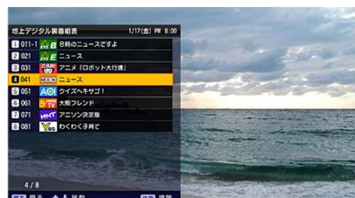
裏番組表イメージ