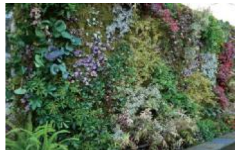
壁面緑化イメージ