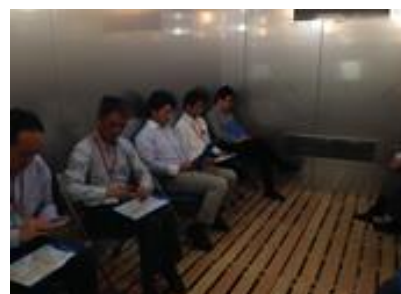
(株)生活品質科学研究所「環境試験室」での着用モニター試験の様子