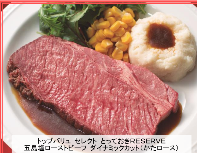
トップバリュ セレクト っておきRESERVE 五島塩ローストビーフ ダイナミックカット(かたロース)

イオンは年末やクリスマスと並びお肉料理のニーズの高まる父の日に向けて、6月3日（水）に全国のグループ約1,400店舗にて、近年人気の赤身肉の旨みを堪能いただけるダイナミックカット（厚切り）の「トップバリュ セレクト っておきRESERVE 五島塩ローストビーフ」と「同 ローストポーク」を新発売します。また、副菜にぴったりの「トップバリュ セレクト マッシュポテト」も同日に新発売し、ご家庭で手軽にお楽しみいただける本格的なレストランのメインディッシュをご提案します。