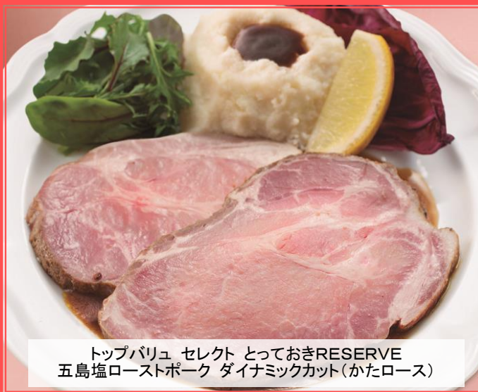
トップバリュ セレクト っておきRESERVE 五島塩ローストポーク ダイナミックカット(かたロース)