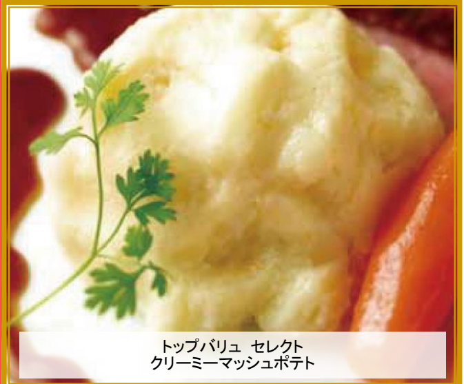
トップバリュ セレクト クリーミーマッシュポテト