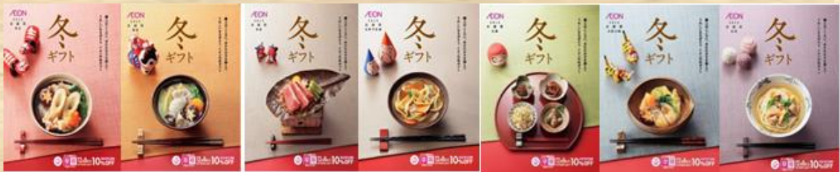
東北 関東 東海 北陸甲信越 近畿 山陰山陽 四国

今年の「イオンの冬ギフト」は地域別のカタログ(7地域)をご用意。地域で食べ継がれてきた伝統の「食」や個性豊かな「味覚」をお楽しみいただける、地元のとびっきりの品々を、をご用意しました。