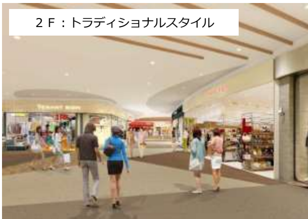
2 F：トラディショナルスタイル