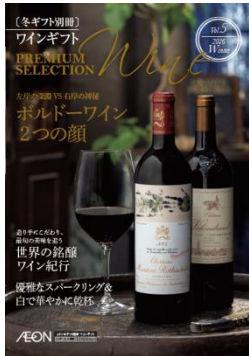
ワインギフト カタログ 合計34品目

左岸と右岸のハイクラスを飲みくらべる贅沢セットです。左岸は、ポイヤックの力強く男性的な“スーパー・セカンド”「シャトー・ピション・ロングヴィル・パロン」。右岸は、今やサン・テミリオン of “スター的存在”で、有機農法による濃密で力強い味わいを誇る「シャトー・パヴィ・マカン」の価値ある2本セットです。