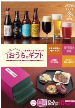
おうちのギフト カタログ