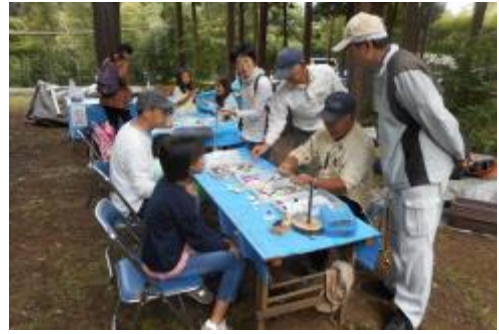
NPO法人しろい環境塾 Donguri 工作 (千葉)

1991年より26年間「生物多様性の保全と持続可能な利用」のため、国内外の地域において、積極的に環境保全活動を継続している団体への助成支援を行っています。2016年度は、植樹、森林整備、砂漠化防止、里地・里山・里海の保全、湖沼・河川の浄化、野生生物の保護、絶滅危惧生物の保護などを行う団体99件に、9,797万円の助成を行いました。累計では2,744件、総額24億9,700万円となりました。2017年も継続して環境活動への助成を実施します。