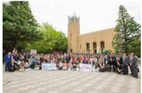
第6回ASEP開講式(早稲田大学大隈講堂)

2017年度は、「生物多様性と再生」をテーマに、王立プノンペン大学(カンボジア)、清華大学(中国)、インドネシア大学(インドネシア)、早稲田大学(日本)、高麗大学校(韓国)、マラヤ大学(マレーシア)、ベトナム国家大学ハノイ校(ベトナム)、チェラロンコン大学(タイ)の8ヶ国合計64名の学生が参加し、8月1日～6日の期間、日本で開催しました。