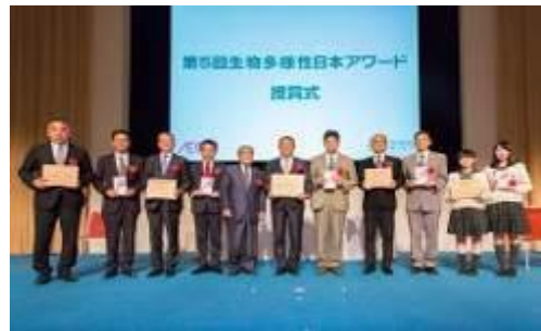
第5回「生物多様性日本アワード」授賞式(国連大学)

生物多様性の保全と持続可能な利用の推進を目的として、「生物多様性みどり賞 (国際賞)」と「生物多様性日本アワード (国内賞)」の2つのアワードを創設し、隔年で顕著な環境保全活動が認められる個人・団体を顕彰しています。2016年度は第4回「生物多様性みどり賞 (国際賞)」を実施し、2017年度は第5回「生物多様性日本アワード (国内賞)」を実施しました。