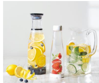
(左) フレーバーウォータージャー (中) フレーバーウォーターボトル