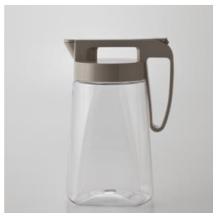
ワンプッシュピッチャー1.6 L