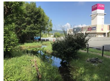
植樹から16年経過した 「イオンモール富士宮」の「イオン ふるさとの森」 （コンテスト受賞写真※）

清掃・除草活動を行う場となる「イオン ふるさとの森」は、新店舗がオープンする際に近隣のお客さまとともに植樹し、育ててきた森です。「お客さまを原点に平和を追求し、人間を尊重し、地域社会に貢献する」というイオンの基本理念を具現化した活動として、1991年にマレーシアのジャスコマラッカ店（現 イオンマラッカショッピングセンター）で植樹をスタートして以来、「イオン ふるさとの森づくり」として国内外で継続しています。2013年には、（公財）イオン環境財団の実施する植樹と合わせた植樹本数が1,000万本を突破し、2017年度末（2018年2月末）時点では、約1,166万本となりました。