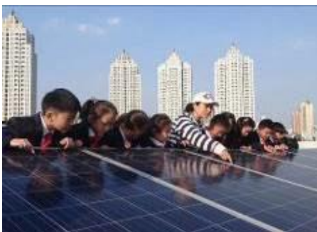
2017年太陽光発電システムの寄贈(中国・武漢)

再生可能エネルギー活用の啓発・普及および環境教育を目的に、国内外の小中学校へ「太陽光発電システムの寄贈」を2009年から行っています。2016年度までに、日本、マレーシア、ベトナム、中国の合計40校に寄贈しました。2017年度は引続き、中国武漢市の小中学校5校を対象に寄贈しました。