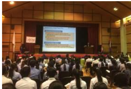
第2回生物多様性を越えて (カンボジア王立プノンペン大学)

国際的な視野で生物多様性の価値を問い直し、新たな価値共有ができる教育を行うことを目的とするプログラムです。2016年10月6日（に）、ベトナム国家大学ハノイ校で初めて開催しました。2017年は、10月13日（金）に王立プノンペン大学（カンボジア）にて開催しました。2018年は、9月23日（日）に、インドネシアのジャカルタで実施する予定です。