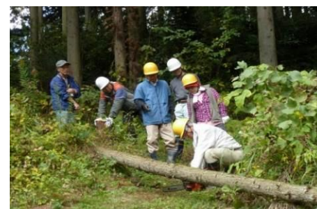
里山の山野草を守る会

累計では2,846件、総額25億9,200万円となりました。2018年も継続して環境活動への助成を実施します。