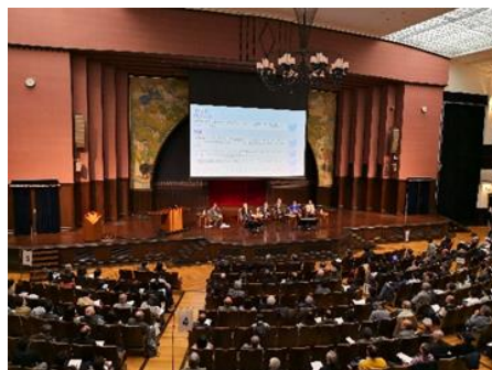
第2回イオン未来の地球フォーラム (東京大学安田講堂)

地球の環境変化や環境問題について、参加者とともに解決方法を考え、実行策を議論し、講演と対話型パネルディスカッションにおいて理解を深め、成果をまとめる「イオン未来の地球フォーラム」を2017年より開催しています。2018年1月20日（土）には、東京大学安田講堂にて、「第2回イオン未来の地球フォーラム」を実施しました。第3回は、2019年2月2日（土）に、同じく東京大学安田講堂にて行う予定です。