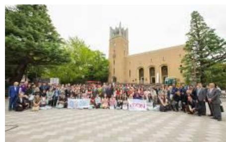
第6回ASEP開講式 （早稲田大学大隈講堂）

グローバルなステージで活躍する環境分野の人材育成を目的として、アジア各国の大学生が集い、各国の自然環境や価値観の違いを学びながら地球環境について国境を越えて討議をする、「アジア学生交流環境フォーラム（ASEP）」を実施しています。2017年度は、「生物多様性と再生」をテーマに、王立プノンペン大学（カンボジア）、清華大学（中国）、インドネシア大学（インドネシア）、早稲田大学（日本）、高麗大学校（韓国）、マラヤ大学（マレーシア）、ベトナム国家大学ハノイ校（ベトナム）、チェラロンコン大学（タイ）の8ヶ国合計64名の学生が参加し、8月1日～6日の期間、日本で開催しました。2018年度は、新たにヤンゴン経済大学を加え、9ヶ国合計72名の学生が参加し、8月2日～5日の期間で、マレーシアのクアラルンプールにて開催する予定です。