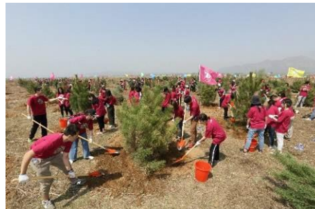
2018年 北京市密雲植樹

各国政府や地方自治体と協力し、自然災害などで荒廃した森の再生を目的として、アジアを中心とした世界各地で植樹を行っています。2018年度は、国内では福島県南相馬市、宮城県亶理町、宮崎県綾町、大分県竹田市、沖縄県糸満市、千葉県千葉市にて、海外では中国北京市密雲区、ミャンマーのヤンゴン、インドネシアのジャカルタにおいて植樹活動を実施します。