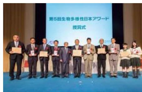
第5回「生物多様性日本アワード」 受賞式（国連大学）

生物多様性の保全と持続可能な利用の推進を目的として、「生物多様性みどり賞（国際賞）」と「生物多様性日本アワード（国内賞）」の2つのアワードを創設し、隔年で顕著な環境保全活動が認められる個人・団体を顕彰しています。2017年度は第5回「生物多様性日本アワード（国内賞）」を実施しました。2018年度は、第5回「生物多様性みどり賞（国際賞）」を実施いたします。