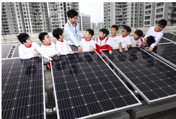
（2018年沪江小学的学生考察太阳能发电系统）