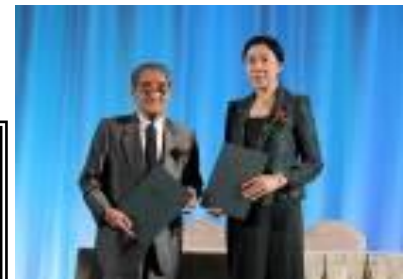
（第四届 中日环境国际论坛）

活跃在世界各地的两国专家、有识之士齐聚一堂，就环境改善和社会的可持续发展进行了讨论。另外，作为本次研讨会的总结，面向全球发布了“永旺北京环境保护倡议”。