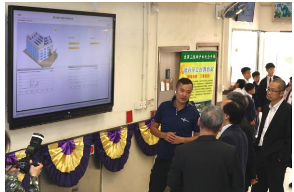
（2018年东华三院邱子田纪念中学的太阳能发电量电子标牌）