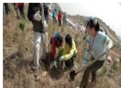
(2008年 山东省烟台市植树)

2008年7月，本财团应烟台市政府之邀，以培育城郊辛安河的水源涵养林为目的，举办了植树活动。来自中日两国的2,519名志愿者，共同栽种了25,000棵树苗，该活动的举办加深了两国市民之间的友情。同样在威海市，也有1,400名中日两国的志愿者参加植树活动，共同栽种了12,000棵树苗。