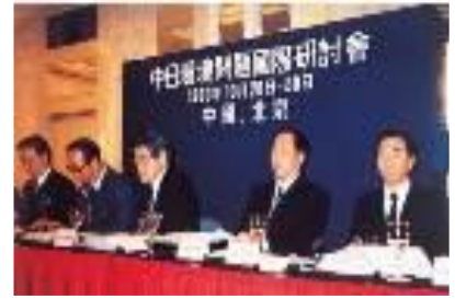
（第一届 日中环境国际论坛）

从“保护地球的未来”这一共同视角出发，为促进国际协作，在本次研讨会的全体会议和分组讨论中，与会者展开了热烈的探讨，前日本首相海部俊树前往出席。最终制定了有关民间层面的环境合作框架与行动指针，同时就本研讨会今后的持续举办达成了一致意见。