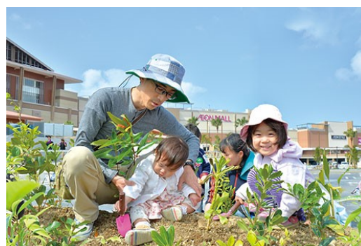
イオン ふるさとの森づくり

イオンの店舗が地域名コミュニティの場となり、そして緑を育む心が地域の人々にも広がっていくことを願い、新たに開業する店舗の敷地内にも、お客さまとともに植樹をしています。これまでに石川県内では「イオンモール新小松」「イオンタウン野々市」「イオンモールかほく」「金沢フォーラス」等、累計約20万本を植樹しました。2021年夏に開業予定の「イオンモール白山」においてもふるさとの森づくりを行う予定です。