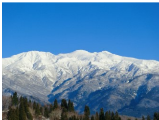
白山ユネスコエコパーク

〈白山市ホームページ: https://www.city.hakusan.lg.jp/ >