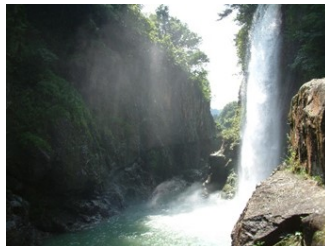
白山手取川ジオパーク