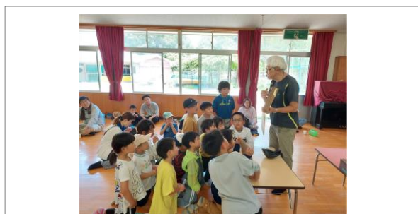
2023. 7. 29 「親と子の昆虫観察会」学習会