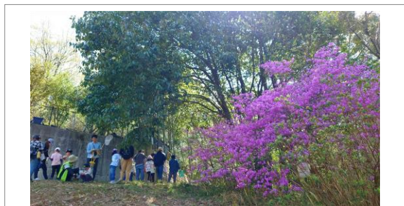
2023. 4. 1 「いぶらの森・自然観察会 2days」