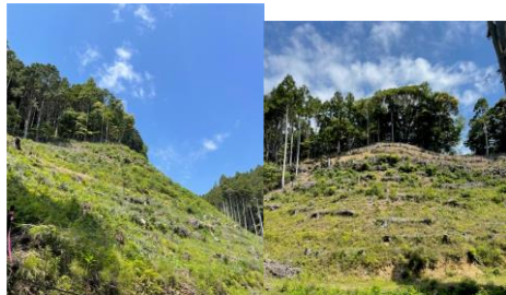
5月16日、2ha 植樹後の下刈り整備作業