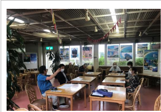
5月29日 スタッフミーティング、下賀茂 熱帯植物園