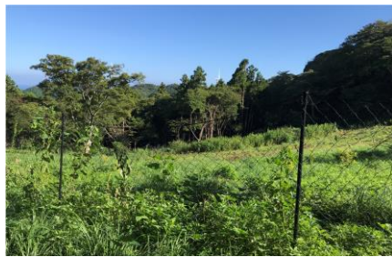
前年度の植樹地 1ha 下刈り整備作業