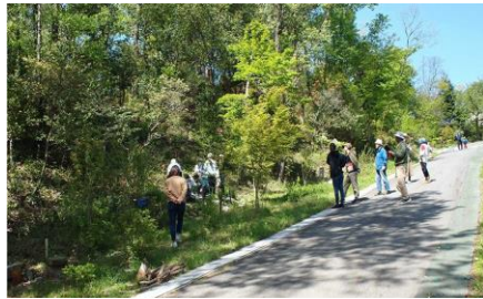
4/23 第1回イベント、新しく作った池でモリアオガエルを観察している