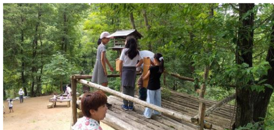
7/2 第2回イベント 制作した巣箱を取り付けている。