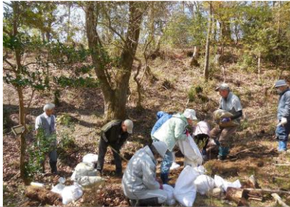
4/10、17 新しいビオトープ（カエル池）づくり