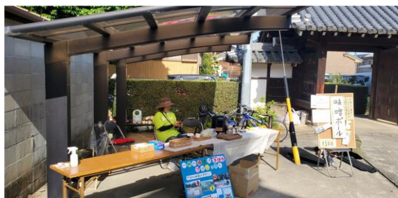
5/4 お寺マルシェにて味噌ボール振舞