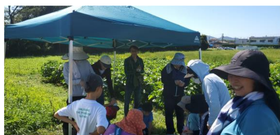
8/11 草取り・味噌きゅうり試食会

昨年までは、メンバー及び知人友人で活動していたが、今年度から新たに SNS で参加を呼びかけ参加者を募った。世代も住んでいる町や価値観も異なる中で、私たちの活動の意義を理解してもらうために、活動の時は思いや方針を伝えることを意識した。