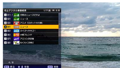
裏番組表イメージ