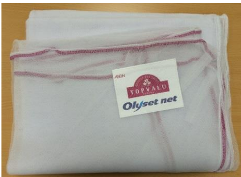
「トップバリュ オリセット®ネット」

イオンは、住友化学㈱の技術協力のもと、感染症を媒介する蚊に対する殺虫効果・忌避効果を持った蚊帳「トップバリュ オリセット®ネット」を、6月21日(土)よりベトナム及びカンボジアのGMS「イオン」で発売します。