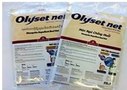
<販売用パッケージ>