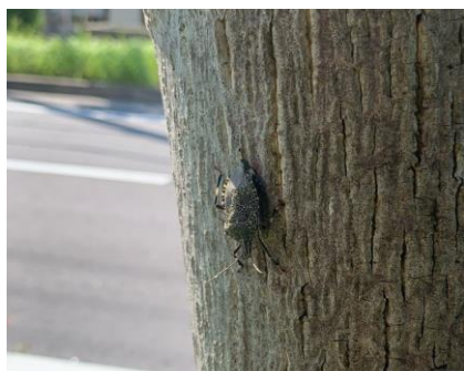
キマダラカメムシ