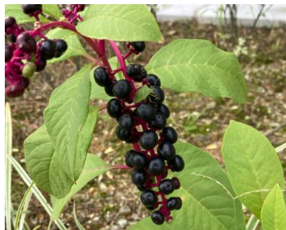
ヨウシュヤマゴボウ