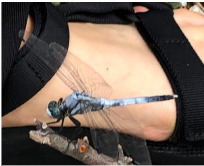
シオカラトンボ