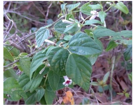
ヘクソカズラ