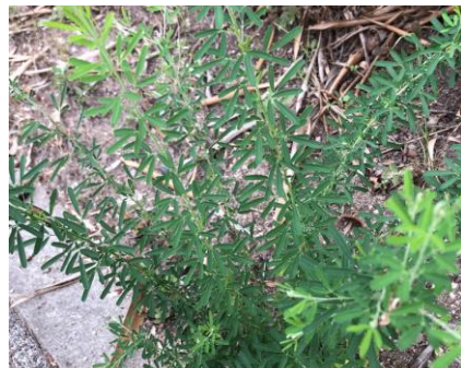
メドハギ ©タロスケ パンダ