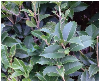
ヒイラギモクセイ