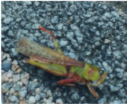
トノサマバッタ