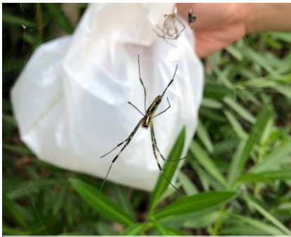
ジヨロウグモ