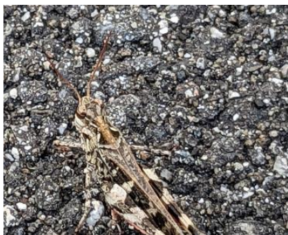
クルマバッタモドキ