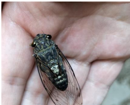
ツクツクボウシ