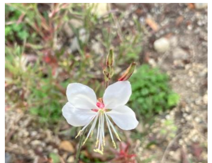
ヤマモモソウ