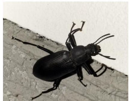
サトユミアシゴミムシダマシ