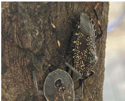
キマダラカメムシ