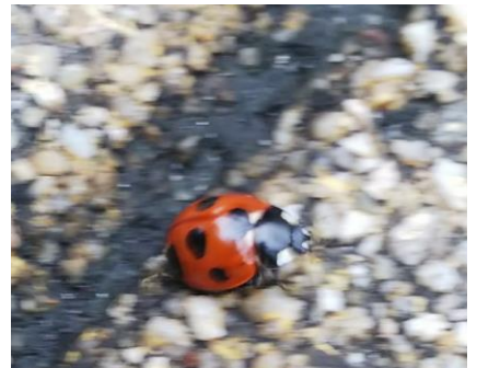
ナナホシテントウ