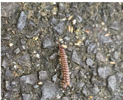
ヤケヤステのなかま