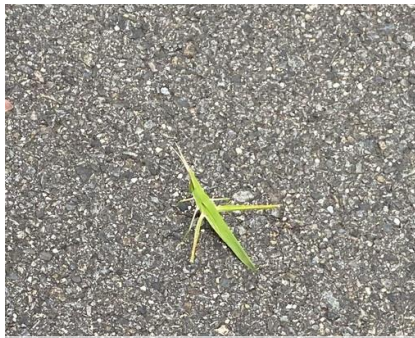
ショウリョウバッタ