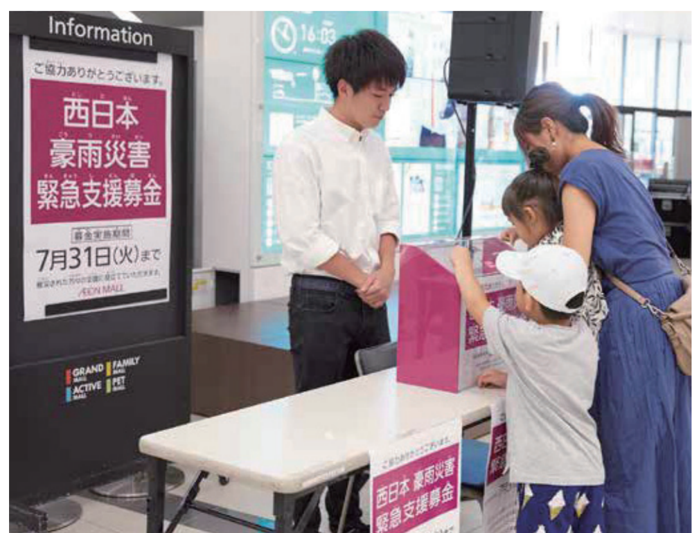
店頭での募金活動(イオンモール幕張新都心)

イオンは、今年7月に発生した記録的な豪雨で甚大な被害を受けた被災地域の一日も早い復旧を願い、7月9日(月)より、全国のイオングループの店舗・事業所約9,300カ所で緊急支援募金を実施しました。募金活動の第1期間にあたる7月31日(火)までに、皆さまからお預かりした合計1億2,188万2,675円を、広島県、岡山県、愛媛県に贈呈。また、(公財)イオンワンパーセントクラブが緊急復興支援金として広島県・岡山県・愛媛県に対し、それぞれ1,000万円、計3,000万円を寄付しました。