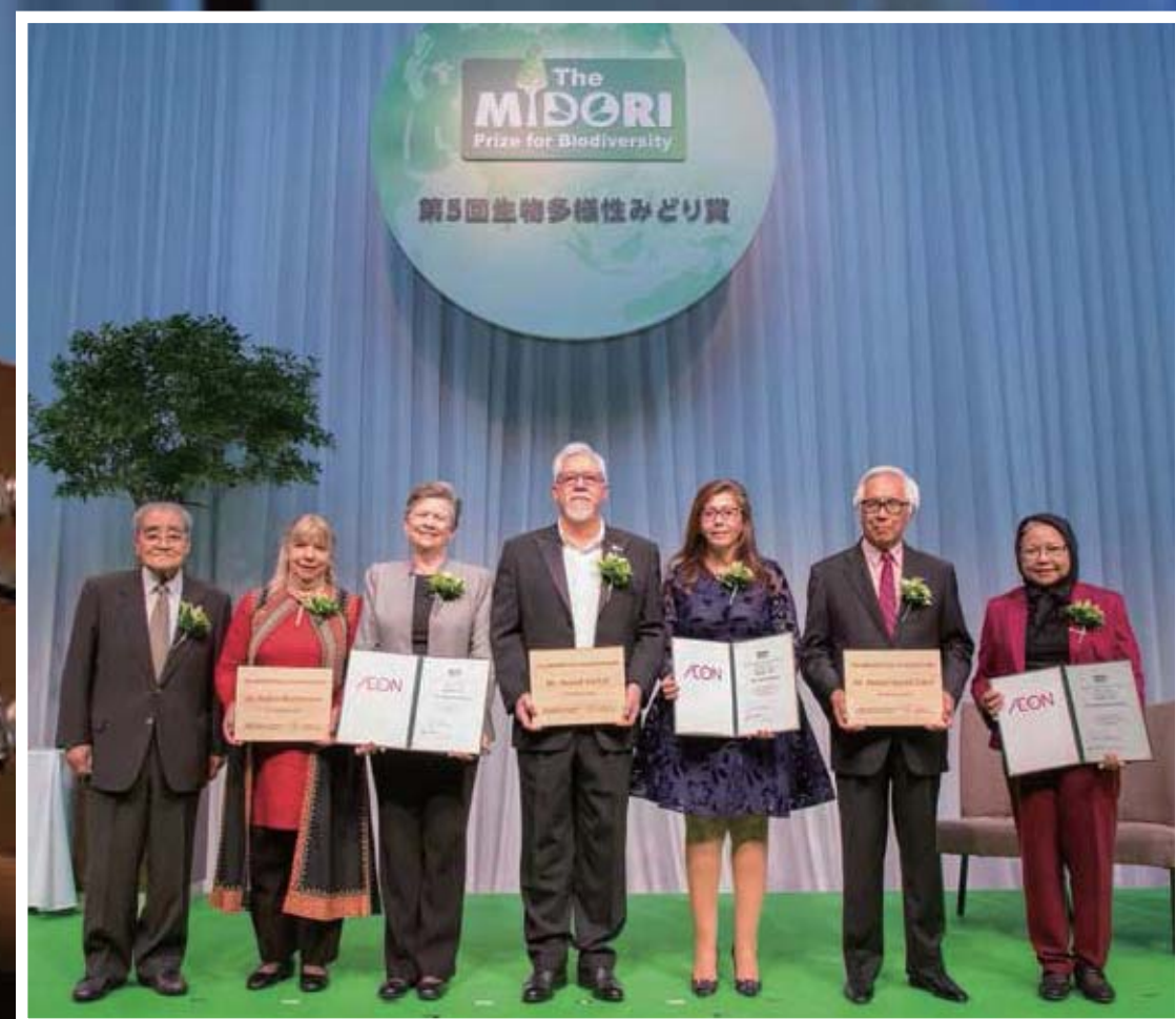
受賞者と(公財)イオン環境財団 理事長 岡田卓也(左)

アブドゥル・ハミド・ザクリ氏 (マレーシア) マレーシア先端技術産官機構 共同議長 前マレーシア首相付科学顧問