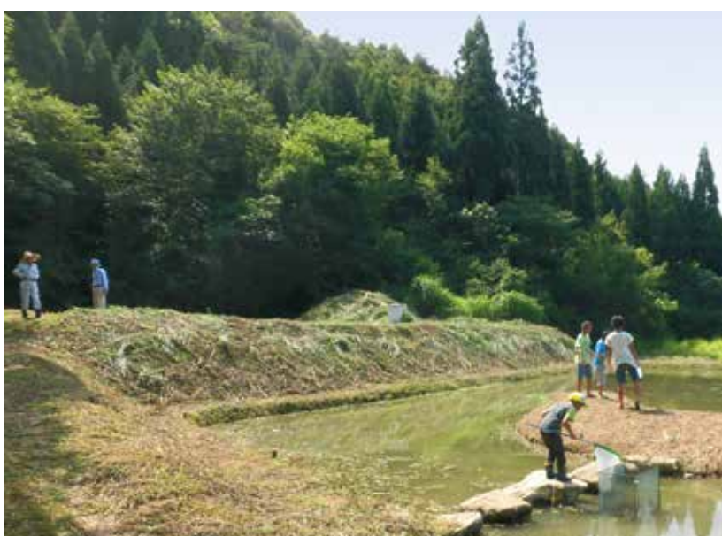
特定非営利活動法人 とうめ (石川県) 源流水による棚田経営・管理と 動植物の多様性保全活動