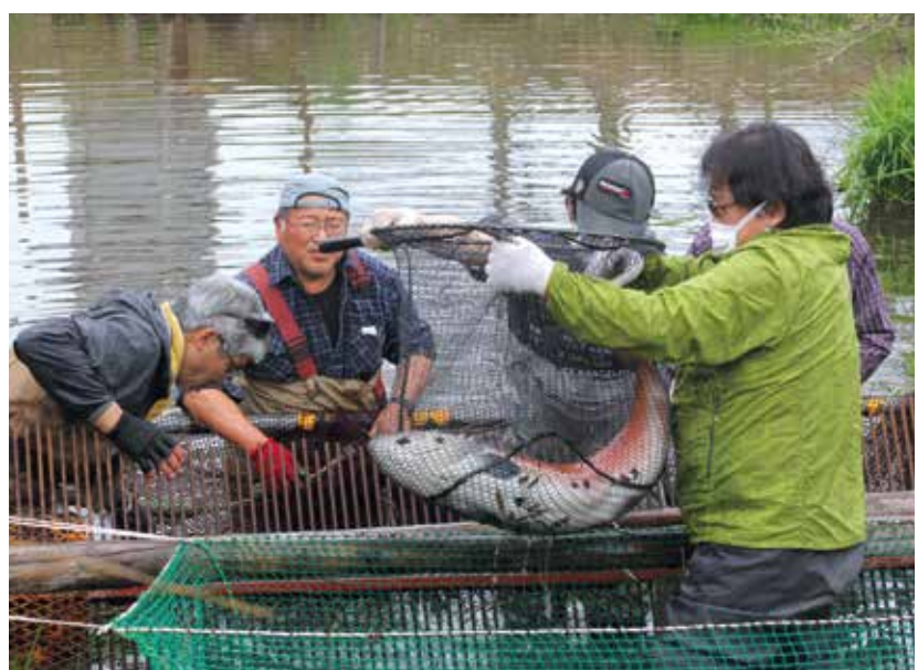
尻別川の未来を考えるオビラメの会 (北海道) 絶滅危惧種イトウ(サケ科)の 個体群復元プロジェクト