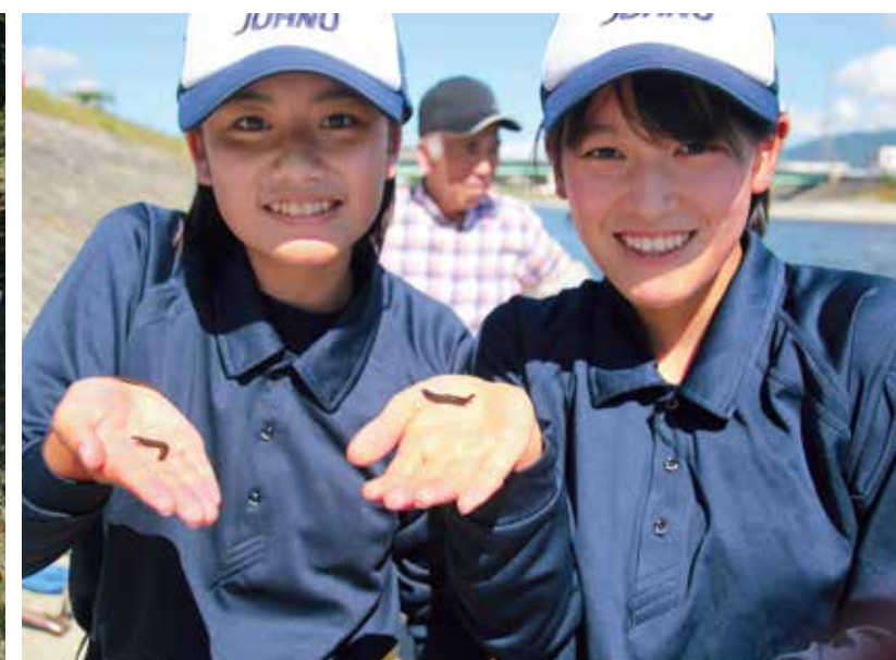
長野県上伊那農業高等学校 コミュニティデザイン科 グローバルコース (長野県) 河川の生態系に関わる昆虫食「ざざ虫」を 未来へ残す活動

「イオン生物多様性みどり賞」は、生物多様性の保全と持続可能な利活用の推進、生物多様性の普及・啓発・共有において、顕著な功績が認められる学校・団体・企業・個人を顕彰する事業です。(公財)イオン環境財団は、国連生物多様性条約事務局(SCBD)とのパートナーシップ協定のもと、国内賞を2009年、国際賞を2010年に創設し、隔年で継続実施しています。今回グランプリを受賞した『O2Farm』は、「ランドスケープ農業」という新しい概念を提唱し、生物多様性のみならず、景観、文化・ライフスタイルにいたるまで統合的な保全を目指している点が評価されました。