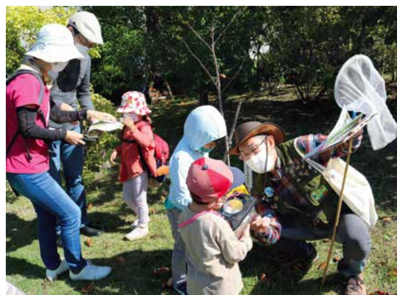
豊田鉄工株式会社 (愛知県) トヨタの森を活用した 生物多様性啓発活動