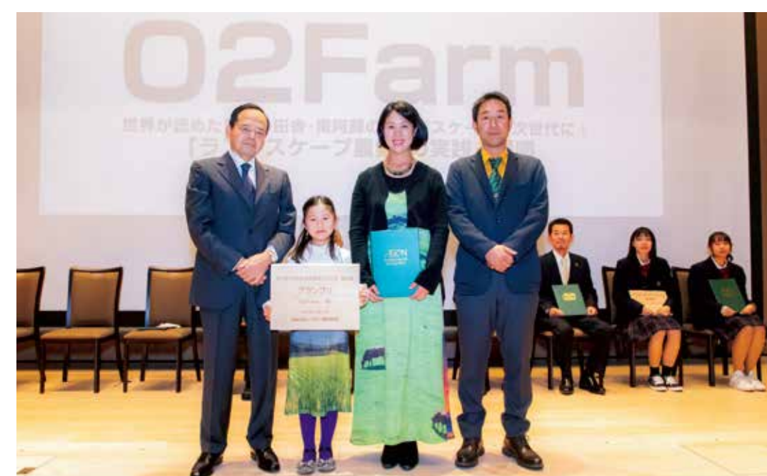
上智大学での授賞式(2022年12月11日)

「イオン生物多様性みどり賞」は、生物多様性の保全と持続可能な利活用の推進、生物多様性の普及・啓発・共有において、顕著な功績が認められる学校・団体・企業・個人を顕彰する事業です。(公財)イオン環境財団は、国連生物多様性条約事務局(SCBD)とのパートナーシップ協定のもと、国内賞を2009年、国際賞を2010年に創設し、隔年で継続実施しています。今回グランプリを受賞した『O2Farm』は、「ランドスケープ農業」という新しい概念を提唱し、生物多様性のみならず、景観、文化・ライフスタイルにいたるまで統合的な保全を目指している点が評価されました。