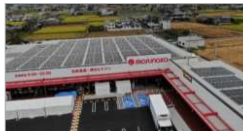
マルナカまんのう公文店の 店舗屋上に設置した太陽光パネル