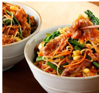
ミールキット 肉うま! コク深い野菜たっぷり ビビンバ丼の具 2人前【冷蔵】 2人前 (499円 /人前) 998円 (税込1, 078円)