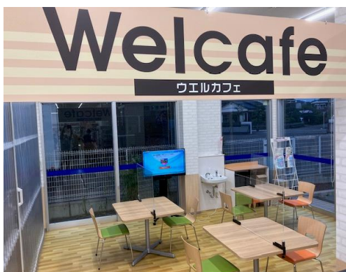
ウエルカフェ(ウエルシア薬局島田金谷店内)