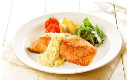
サクラマスのムニエル

※ 1 ：関東・北陸信越・東海・近畿・中四国の店舗です。一部取り扱いのない店舗がございます。