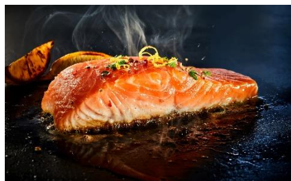
サクラマスのレアステーキ

サクラマスは、身に含まれる脂の量が多く、旨みが詰まっており、身も非常に柔らかい魚です。ステーキにしたり、ムニエルにして食べていただくのもおすすめです。