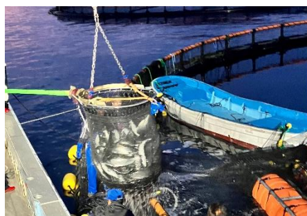
サクラマスの水揚げの様子