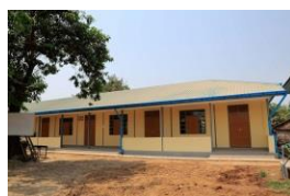
ミャンマー新校舎