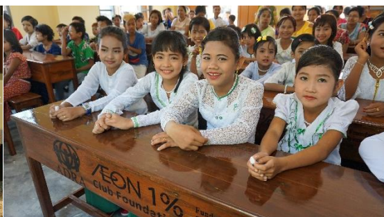
新しい校舎に喜ぶ子どもたち