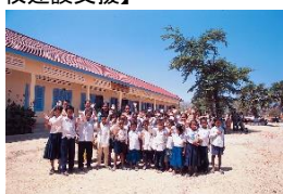
新校舎と子どもたち(カンボジア)