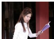
イオン ふるさと発見伝