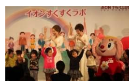
イオン すくすくラボ

* 活動の詳しい内容はこちら ( https://www.aeon.info/1p/ ) をご覧ください。