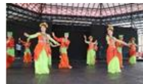
インドネシアで伝統舞踊体験