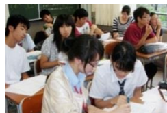
中国での授業体験