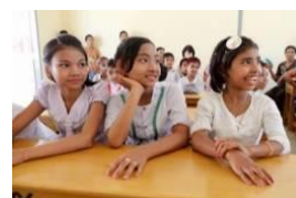
新校舎で学ぶ子どもたち(ミャンマー)