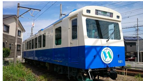
※画像はイメージです。