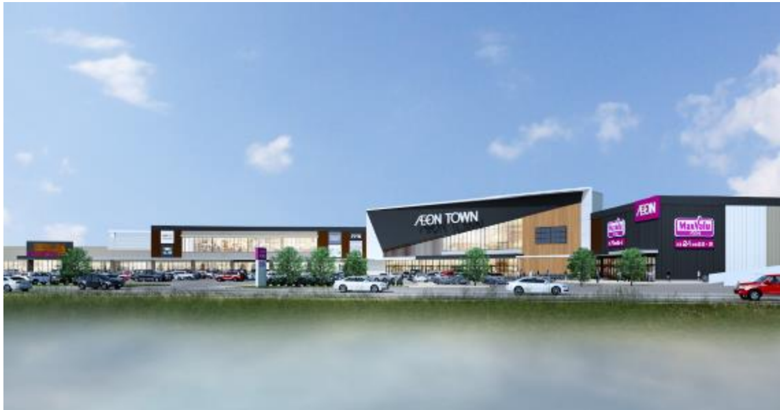
国道1号線側から見たイメージ

～地域の皆さまに寄り添い、これまで以上に笑顔でお過ごしいただけるSCを目指して～ 『集い・育み・元気発信！3世代パワーステーション』