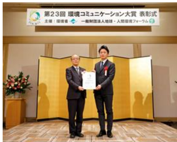
2月19日の表彰式にて。左は八木哲也 環境大臣政務官。

環境省と一般財団法人地球・人間環境フォーラムが主催する表彰制度「環境コミュニケーション大賞」は、優れた環境報告書や環境経営レポートの表彰することで、事業者の環境経営と環境コミュニケーションを促進するとともに、環境に関する情報開示の質の向上を目的としています。第23回環境報告部門殿堂入り対象事業者は、第21回及び22回の過去2年間において「環境報告大賞」、「持続可能性報告大賞」、「地球温暖化対策報告大賞」を受賞した6社です。