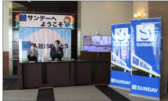
受付にサーモグラフィを設置して、参加者の 体温を確認（サンデー会場）