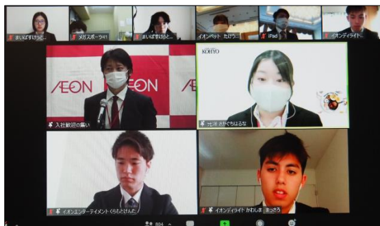
サステナブルチャレンジ取り組み報告