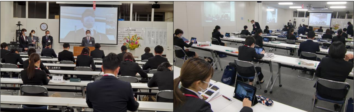
マックスバリュ西日本株式会社 統合後、初めての入社式。3つの会場をつなぎ合計93名が参加。タブレット端末を利用した研修