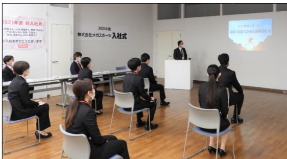
株式会社メガスポーツ 42の配属店舗と繋ぎ、合計72名が参加