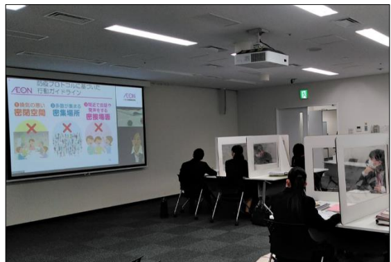
防疫プロトコルは、参加者全員の共通教育項目に 設定（イオン北海道会場）