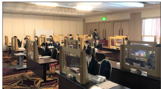
イオンペット株式会社 感染防止に努めた4会場で合計55名が参加