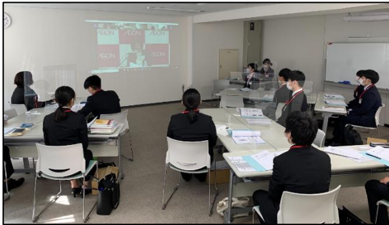
まいばすけっと株式会社 総勢93名が、オンラインで繋ぎ参加