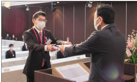
株式会社サンデー 新入社員48名の代表者に辞令を交付