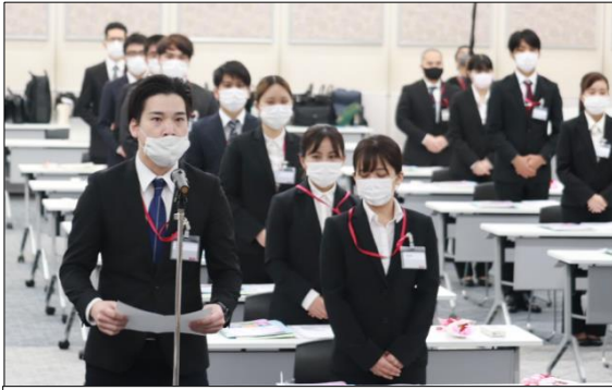
イオン琉球株式会社 新入社員41名を代表して、熱い決意を表明