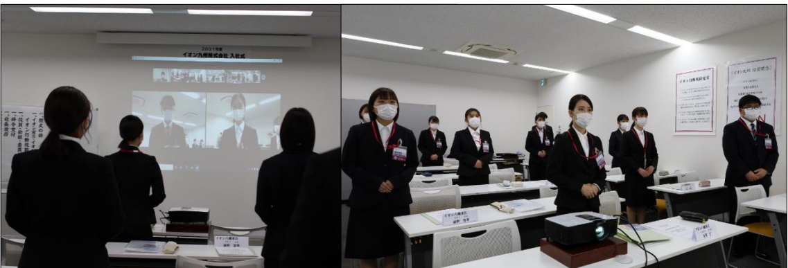
イオン九州株式会社 統合後、初めての入社式。12の会場を繋ぎ合計99名が参加。代表者が決意を表明