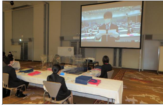
イオンリテール株式会社 7会場から、それぞれの代表者が決意表明