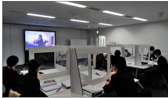
イオン北海道株式会社 18の会場を繋ぎ、合計131名が参加