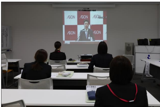
「イオン入社歓迎の集い」は、約800の拠点と 繋ぎ、ライブで配信（イオン九州会場）