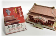
（左から）甦れ！首里城ピンバッジ、一筆箋（16種セット）、甦れ！首里城Tシャツ、美術模型首里城正殿