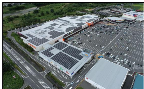
PPAモデルが採用されている「イオンタウン湖南ショッピングセンター」

また、脱炭素型住宅（ZEH）の新築・リフォームや電気自動車（EV）の購入を検討しているお客さまに向けた商品や金融サービスの提供にも力を入れ、地域全体での脱炭素社会の実現を目指しています。