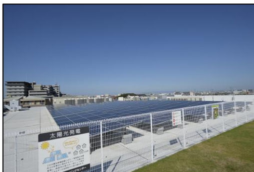
2019年に開業したイオン初の再エネ100%店舗「イオン藤井寺ショッピングセンター」