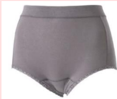
おなかすっぽりタイプ 吸水量：最大30cc