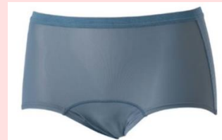
スポーティタイプ 吸水量：最大30cc

これからもイオンは、女性のお悩みに寄り添い、より快適な生活をサポートする商品の企画・開発に取り組んでまいります。