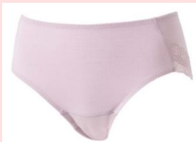
レギュラータイプ 吸水量：最大20cc