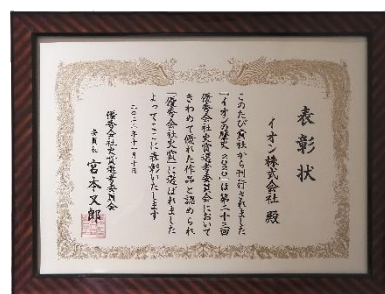
「優秀会社史賞」表彰状