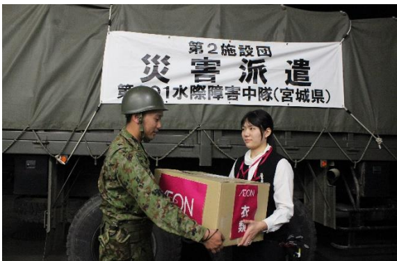
2019年10月 東日本台風時、支援物資を運搬

その後も、2016年4月熊本地震の際は、資機材を空港から被災地の避難所へ陸上自衛隊により運搬いただきました。また、2019年10月東日本台風の際には、内閣府からの要請による支援物資を、孤立化した地域に陸上自衛隊と協力しお届けしました。平時においても、イオンの商業施設を使った大規模な防災訓練に参加協力いただいています。