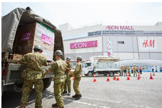
2017年7月 グループ防災訓練への参加