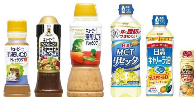
回収対象商品一例