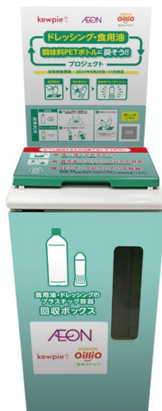
回収ボックスイメージ