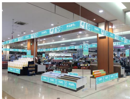
※特別催事店舗での展開イメージ