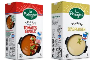
左) ラ・ポタジュールトマトとバジルのスープ 右) アスパラガススープ

価 格：トマトとバジルのスープ 1,030g 本体398円（税込429.84円） アスパラガススープ 1,030g 本体498円（税込537.84円）