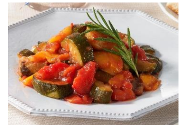
トップバリュ プロのひと品シリーズ 夏野菜のラタトゥイユ