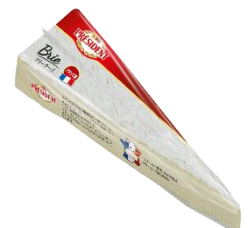
PRESIDENT ブリーチーズ 90g

特 長：ヨーロッパチーズNo.1ブランド「PRESIDENT」ブリーチーズはマイルドでミルクィな味わいが特長です。パンやクラッカーとともに楽しめます。