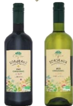
トップバリュ グリーンアイオーガニック オーガニック AOP ボルドー 左) ルージュ 右) ブラン