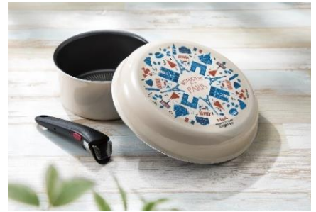
T-f a l パリ・コレクション