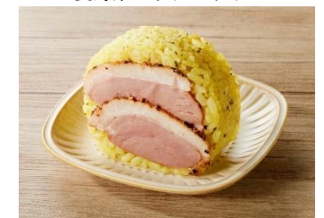
トップバリュ 合鴨のデミソースおにぎり

フランス・パリを中心に話題の「パリおにぎり」は、日本のおにぎりにパリならではの具材や味付けなどを組み合わせたアレンジグルメです。各メディアでも話題になるなど、日本国内でも関心が高まっているパリおにぎりを、トップバリュよりフランスフェア期間限定で販売します。