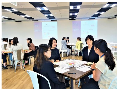
グループディスカッション