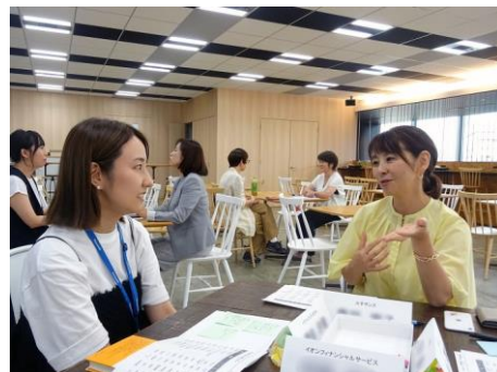
メンターとメンティーの顔合わせ