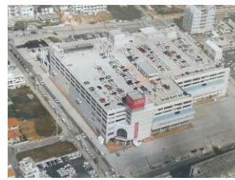
ジャスコ那覇店開店