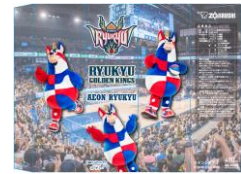
パッケージデザイン案