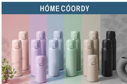
ランドセルとコーディネートできる6色展開

3月1日（土）より順次、イオンのプライベートブランド「HÓME CÓORDY（ホームコーディ）」より、ランドセルの人気カラーから着想を得た「ワンタッチマグボトル」を新発売します。トレンドのピンク、パープル、水色、ミント、ベージュのくすみカラーのほか、ベーシックなブラックを加えた計6色を取り揃え、毎日使いやすい機能性にもこだわっています。