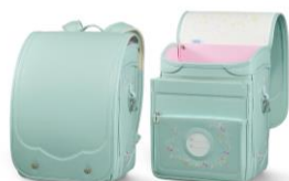
フローラルバスケット

小マチが3cmから8cmへ伸び、荷物量に合わせて拡張が可能です。大マチ13.5cmと合わせて総マチ最大21.5cmあり、かるすぽ最大容量です。しっかり収納でき、手荷物なしの安全で安心な通学をサポートします。