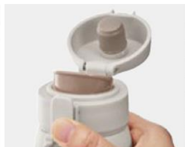
押しやすい大きめプッシュボタン

展開店舗：「イオン」「イオンスタイル」約370店舗および「イオンスタイルオンライン」