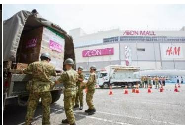
2017年7月 グループ防災訓練への参加