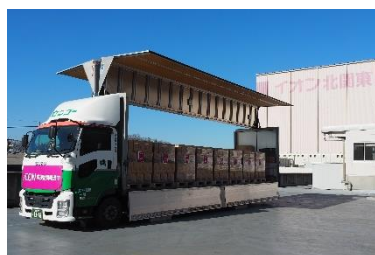
2024年1月 能登半島地震時、支援物資お届け (陸上自衛隊を含む行政からの依頼)

※南海レスキューとは自衛隊中部方面隊が実施している災害救助訓練の一つで、南海トラフ地震など大規模な地震災害に対応するための準備を行うもので、自衛隊員が迅速かつ効果的に被災地での救助活動を行うことを目的としています