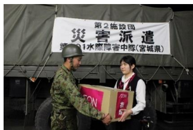
2019年10月 東日本台風時、支援物資を運搬