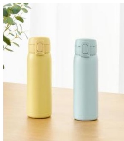
<パッキン一体型スクリューマグボトル>