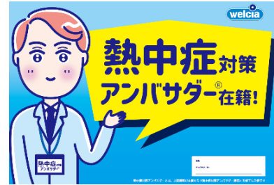
イオンのクールスポット ウエルシア店舗内のクーリングシェルター