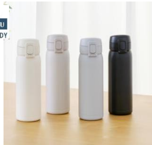
<ワンタッチマグボトル>