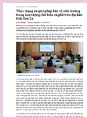
ワークショップの様子が現地メディアで紹介されました

FIDR もソラ省のコーヒー生産の持続的な発展を後押しするため、事業を通じて生産農家に対し、環境や水資源の保護を進めるよう働きかけを続けます。